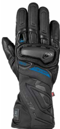
IT-KAYO Gant chauffant touring premium

LE PRIMALOFT® GOLD CROSS CORE™ EST UTILISÉ SUR TOUS LES GANTS IT-SERIES :