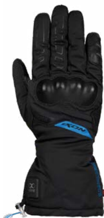
IT-YUGA Gant chauffant touring pour homme