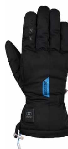
IT-YASUR Gant chauffant urbain