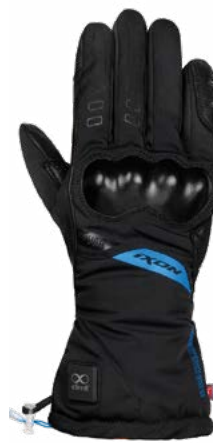
IT-YUGA LADY Gant chauffant touring pour femme